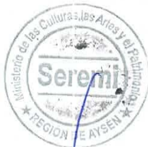
FELIPE QUIROZ VÁSQUEZ SECRETARIO REGIONAL MINISTERIAL DE LAS CULTURAS, LAS ARTES Y EL PATRIMONIO - REGIÓN DE AYSÉN